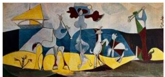
La joie de vivre, Picasso

Aquesta zona constitueix avui el centre històric d'Antibes. Més tard la família dels Grimaldi, els prínceps de Mònaco, prendrà el control de la ciutat, on construiran un castell, avui Museu Picasso , que visitarem per veure les seves obres cabdals. A més de la bellesa del lloc, és un museu molt íntim en quan a l'exposició d'obres de Pablo Picasso. També gaudirem del port fortificat .