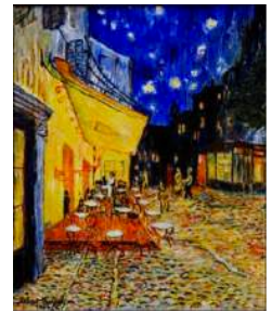
Café la Nuit, Van Gogh

➤ Acte artístic de la jornada: Pintura en directe de l'artista Mariona Millà, (nocturn). Interpretació pictòrica contemporània del quadre " Café la Nuit " des del mateix lloc que el pintà Van Gogh.