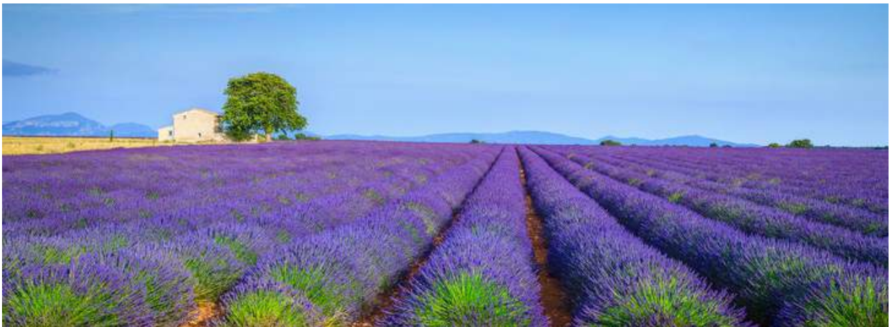
Camps de lavanda de Valensole

Esmorzarem a l'hotel. Començarem el viatge de tornada fent una bonica ruta per Manosque . Es tracta d'un poble medieval amb dues portes monumentals al nord i al sud del nucli antic: la porta Saunerie, d'estil romànic, vestigi prestigiós de la vila a l'edat mitjana, que avui és l'entrada principal a la ciutat) i la porta Soubeyran, del segle XIV. Destacables són la seva església romànica (reconstruïda al segle X) de Notre Dame de Romigier, l'església romànic-gòtica de Sant Salvador (segles XII-XIII) o la capella de Sant Pançraç, a la part alta del turó.