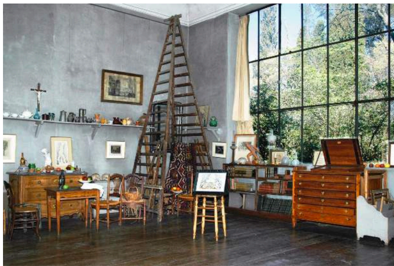
Estudi-Museu de Cézanne

Esmorzarem a l'hotel. Completarem la visita a Aix en Provence , ciutat natal de Paul Cézanne , dirigint-nos cap a l' estudi-museu de Cézanne . Després de la venda de la propietat del Jas de Bouffan, Cézanne va construir un estudi en el pujol de Lauves on crearà obres mestres. Tots els dies, el pintor es va dirigir des del seu apartament del carrer Boulegon al seu lluminós estudi. Envoltat d'un romàntic jardí, l'estudi conserva intacta la memòria de l'artista. Cézanne va instal·lar el seu cavallet en diverses ocasions prop del camí de la Marguerite i va escollir el punt de vista més elevat en relació a la muntanya. Va tornar diverses vegades entre 1902 i 1906 per acabar 11 olis i 17 aquarel·les avui conservades en museus de tots el món i en col·leccions particulars.